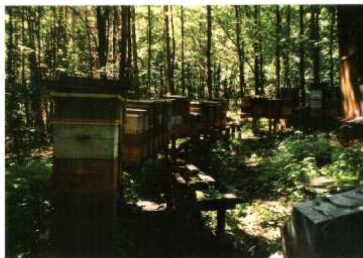
ŽELECHOVICE VÍDOVÁ - LESNÍ STANOVIŠTĚ