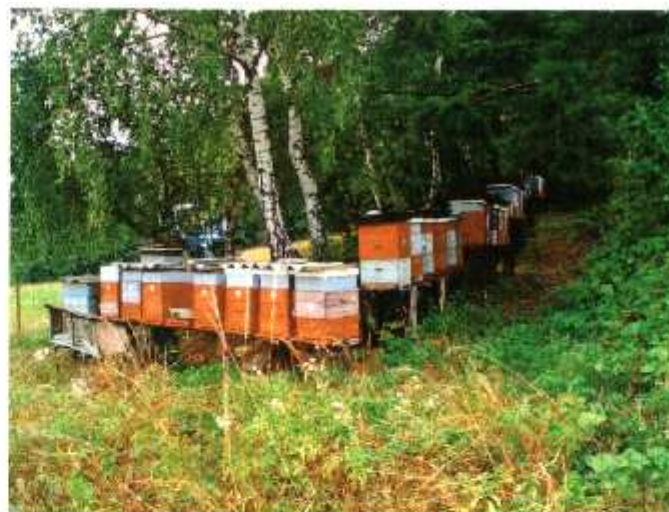
LHOTSKO - PODHOŘÍ