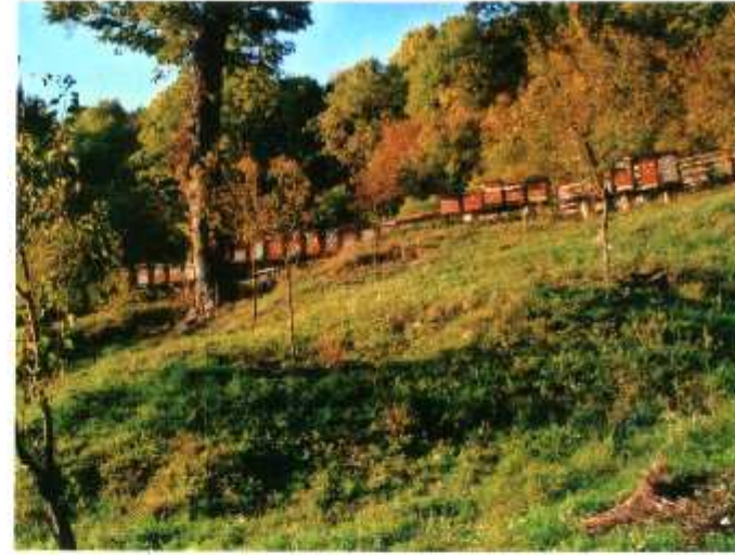
CHOVNÁ STANICE PASEKY