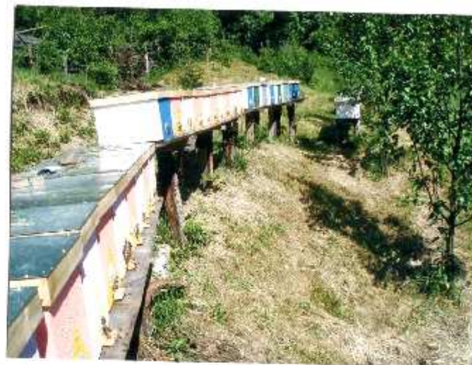
CHOVNÁ STANICE 2012