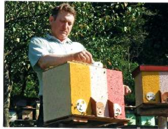
CHOVNÁ STANICE 2012