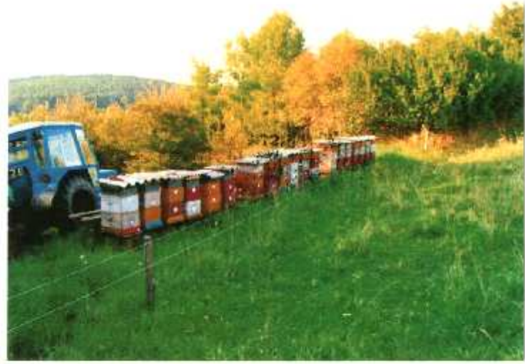
VIZOVICE - SAD