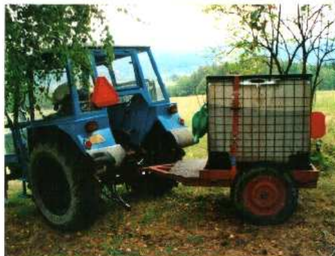
KRMENÍ TEKUTÝM ROZTOKEM