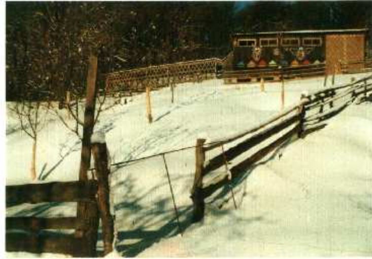
PASEKY ZA HÁJEM