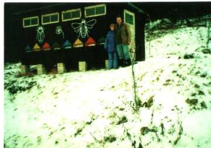
VČELÍN NA PASEKÁCH