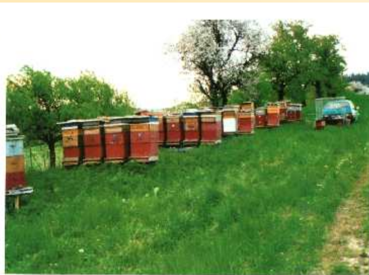
VIZOVICE - RUDOLF JELÍNEK