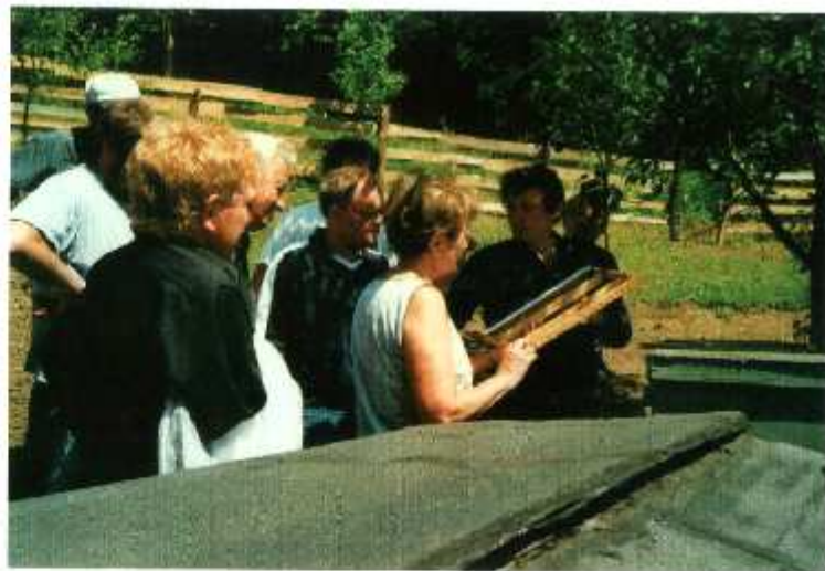
KURZ - CHOV MATEK